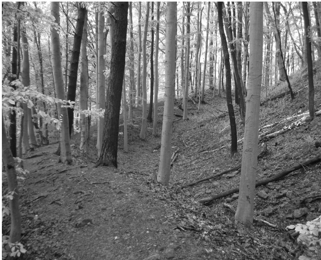
Obr. 3: Hrad Starý Světlav – východní úsek valu a příkopu kolem hradního jádra.