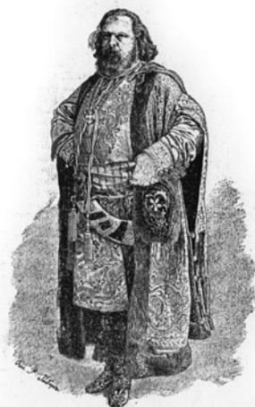
Дмитрій Александровичъ Агренёв-Славянскій. Dmitrij Aleksandrovič Agreněv-Slavjanskij.