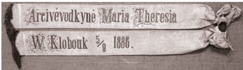
Spolek vojenských vysloužilců Valašské Klobouky, praporové stuhy. Městské muzeum Valašské Klobouky, Historická a etnografická sbírka, inv. č. 4027.