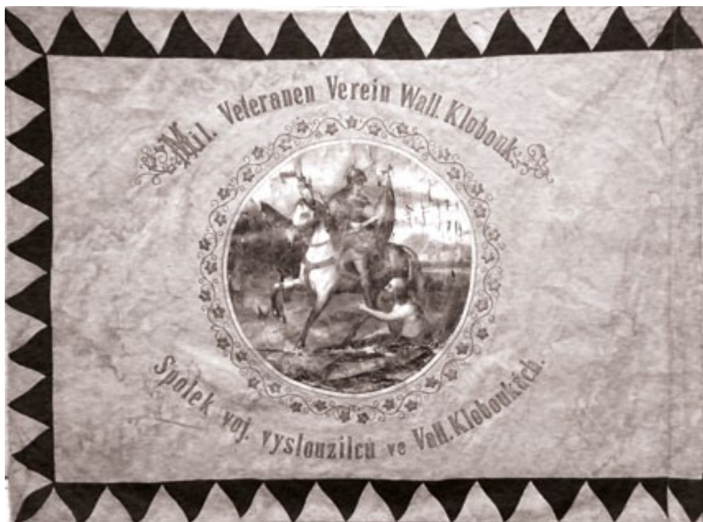
Spolek vojenských vysloužilců Valašské Klobouky, prapor (avers). Městské muzeum Valašské Klobouky, Historická a etnografická sbírka, inv. č. 4026.